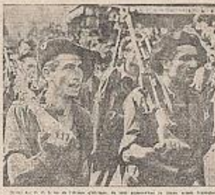
Reddition totale des troupes de Bohême

« N'oublions pas la tâche qui reste à accomplir » déclare M. Churchill