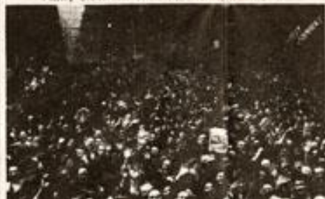
Victory Crowd Cheers in Flag-Draped Times Square

BERLIN, Thursday, May 7 (AP)—After the rubble that remains of the most hard-battled city in the world, the sea of debris that stretches unbrokenly over the city and the twisted skeletal remains that rise from the wreckage of the city, the Red Army, which has taken the city, has begun to clear the rubble.